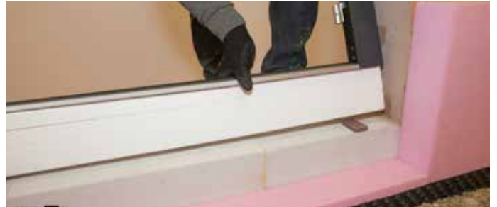
2: Ausrichtung der Dämmschwelle