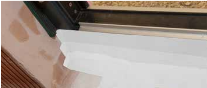
5: Anbringung der Dampfsperre an der Türschwelle