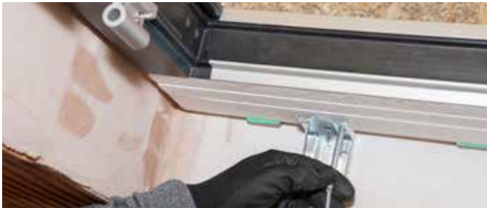
3: Fixierung des COMPACFOAM Profils mit einem Winkel