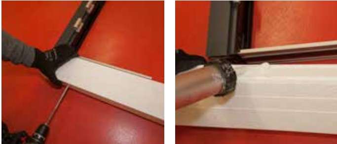
1: Verschraubung bzw. Verklebung des COMPACFOAM Profils auf der Türschwelle