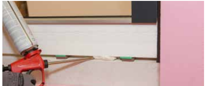
4: Ausbildung der Anschlussfuge